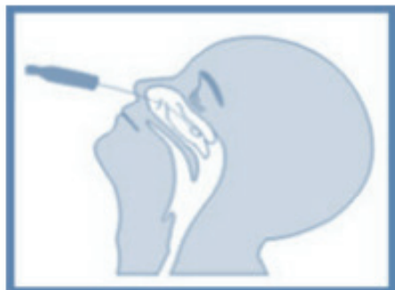
A – Swab nasal.