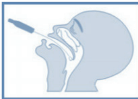
B – Swab oral.