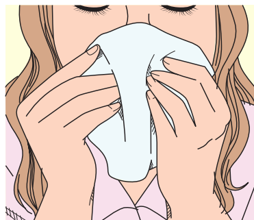
Figura 1 - Orientações para assoar e tossir.

O paciente diagnosticado com COVID-19 em isolamento domiciliar deve ter uma lixeira exclusiva para destinar os resíduos originados no dia-a-dia do tratamento e no processo de recuperação (ABRAFARMA, 2020).